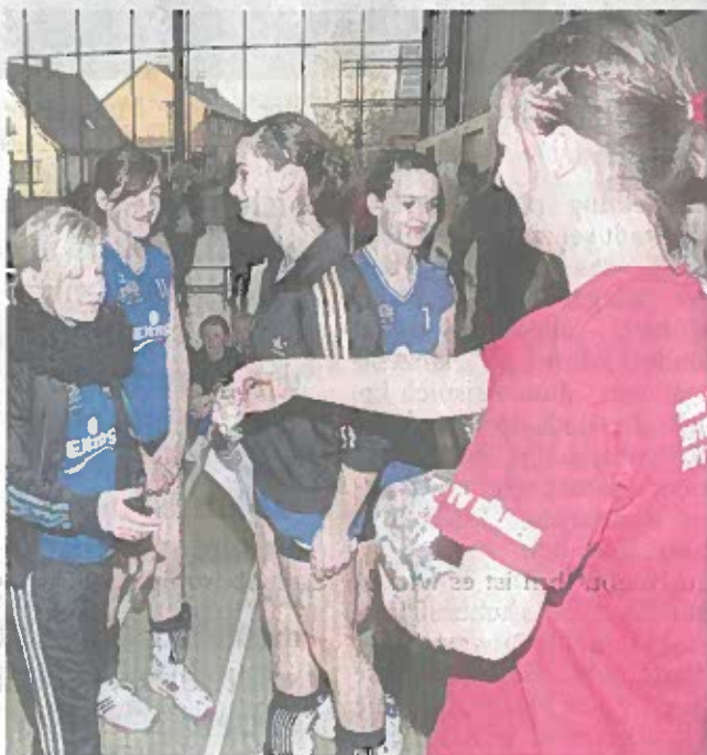
Das Team des TV Dülmen wurde für Rang drei bei den D-Juniorinnen geehrt.