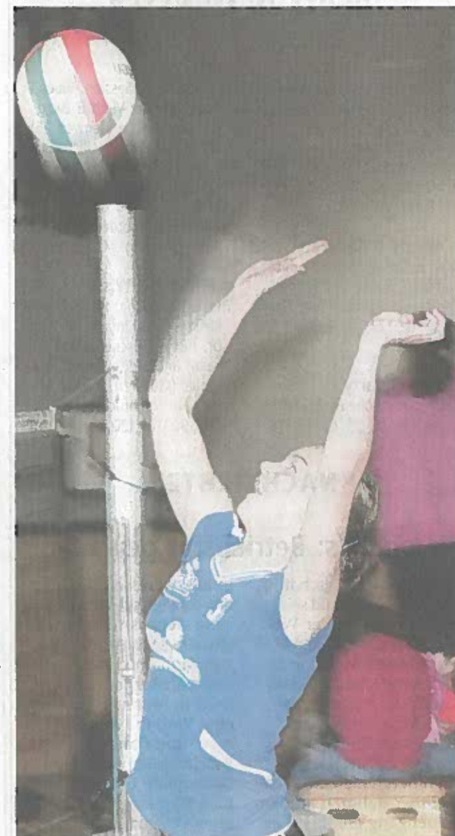
An zwei Tagen pritschte, baggerte und schmetterte der Volleyball-Nachwuchs in Dülmen.

Bei den C-Jugendlichen am Samstag traten 15 Teams an. Gastgeber TV Dülmen belegte die Plätze sechs und acht. Die erste Mannschaft des TV Dülmen verpasste hier nur ganz knapp die Finalrunde. Bei diesem Turnier setzte sich Borken vor Sen-